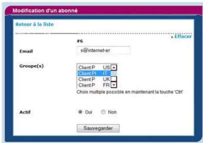
Ecran de création des abonnés

Conformément à la législation, un abonné peut se désabonner de la liste par un simple clic sur un lien situé en bas de la « news letter ».