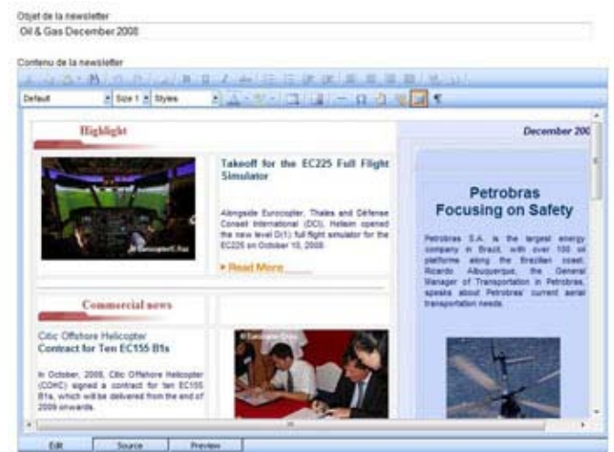
Interface de création de publication

Les publications sont affichées à l'écran par liste, le rédacteur peut les visualiser ou les modifier.