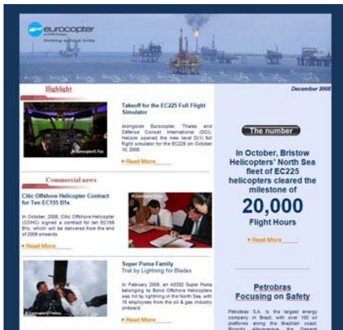
Exemple de publication au format html

Dans un format de type « newsletter » et selon une charte graphique prédéfinie, vous concevez, publiez, puis diffusez par E-mail à une liste ciblée de destinataires groupés, vos diverses lettres d'information à contenu technique, commercial, etc.